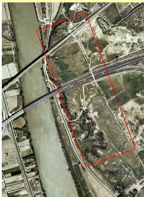
Localització del campament romà de la Palma, sobre la terrassa fluvial del riu Ebre.