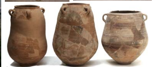
Àmfora greco-itàlica, tenalles i àmfors ibèriques procedents de l'enderroc de les torres del Castellet de Banyoles (Museu d'Arqueologia de Catalunya-Barcelona).