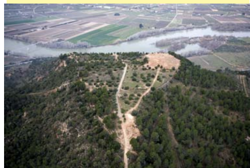
Vista aèria de la plataforma ocupada per l'assentament, amb les torres pentagonals del sistema defensiu en primer terme.