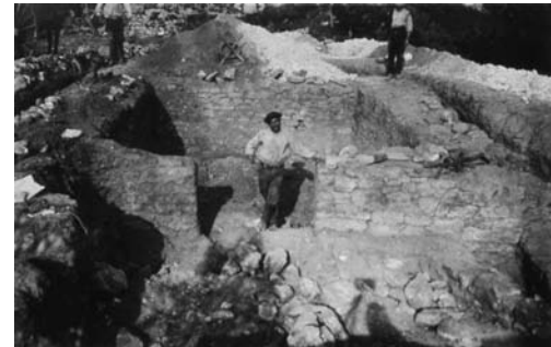
Excavacions de la torre sud durant 1930.